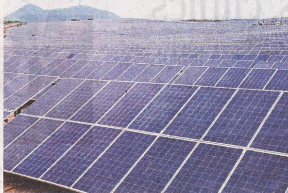
Not a sunny prospect: Photovoltaic modules had so far generated a waste of nearly 2.85 lakh tonnes.

India currently considers solar waste a part of electronic waste and does not account for it separately, according to a response to a question in the Rajya Sabha. Minister for New and Renewable Energy (MNRE) R.K. Singh said a committee had