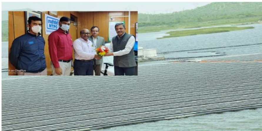
NTPC Ramagundam is now the largest Floating Solar PV Station in India with total 37.5 MW operating and declared commercial

NTPC Ramagundam has declared, the second part capacity of 20 MW commercial with effect from 22.12.2021 for its 100MW Floating Solar PV Project. This is in addition to the 17.5 MW which is in operation since 28.10.21. With this NTPC Ramagundam is now the largest Floating Solar PV Station in India with total 37.5 MW operating capacity.