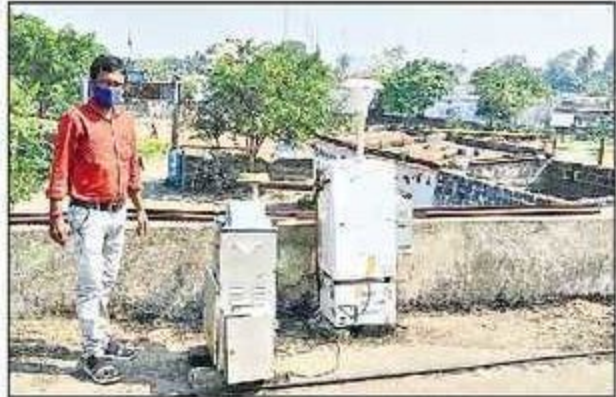
పరికరం ద్వారా వాయు కాలుష్య పరీక్షలు నిర్వహిస్తున్న అధికారి

నిర్వహించారు. యాష్ పాండ్ నిర్వహణ కార్యాలయం వద్ద అంబియంట్ ఎయిర్ క్వాలిటీ మానిటర్ పరికరాన్ని ఐదవారం ఉదయం 6 గంటలకు బిగించి గురువారం ఉదయం వరకు 24 గంటల వాయు కాలుష్య పరీక్షలు చేపట్టారు. జల కాలుష్య పరీక్షలకు గ్రామంలో శ్రీవేంకటేశ్వర స్వామి ఆలయం, మన్నెవాడ వద్ద చేతిపంపుల నీటి నమూనాలు సేకరించారు. వరంగల్ జోనల్ కార్యాలయం ల్యాబ్ కు పరీక్ష నమూనాలు పంపించనున్నట్లు స్థానిక పీసీబీ ఈఈ