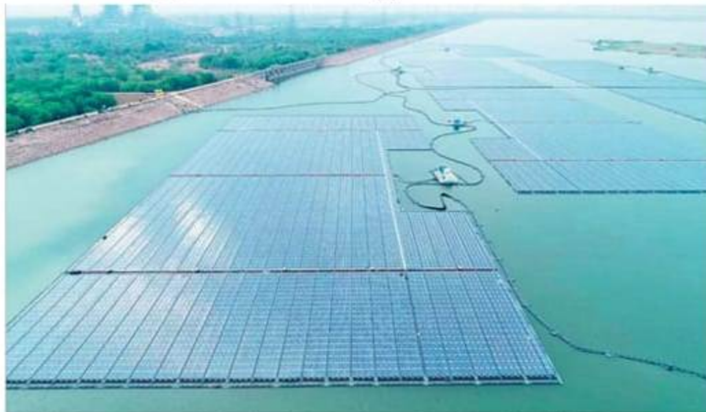
Blocks of NTPC Ramagundam floating solar power plant in Peddapalli district.

The project is unique in the sense that all electrical equipment including inverter, transformer and HT panel and SCADA are on floating ferrocement platforms. The anchoring of the system is through concrete blocks.