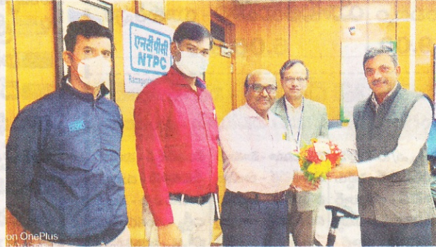
ఎన్టీపీసీ ఫ్లోటింగ్ సోలార్ ప్రాజెక్టు