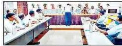
చర్చల్లో పాల్గొన్న అధికారులు, ఎమ్మెల్యే, నాయకులు

జ్యోతిసగర్, న్యూస్టుడే: రామగుండం ఎన్టీపీసీలో ఒప్పంద కార్మికులకు 2018లో చేసుకున్న ఒప్పందం అమలు తీరుపై ఎమ్మెల్యే కోరుకుంటే చందర్, కార్మిక శాఖ అధికారులు, యాజమాన్యం, గుత్తేదార్లు, నాయకుల మధ్య బుధవారం నిర్వహించిన చర్చల్లో పురోగతి కనిపించింది. ఎన్టీపీసీ ఉద్యోగ వికాస కేంద్రంలో నిర్వహించిన చర్చల్లో సుదీర్ఘంగా ఒప్పంద అంశాలపై చర్చించారు. సీనియర్ కార్మికులతో పాటు ఐటీఐ పూర్తి చేసిన కార్మికులకు పదోన్నతులు ఇవ్వటానికి గుత్తేదార్లు, యాజమాన్యం అంగీకరించింది. ఇందులో భాగంగా 15 రోజుల్లో కమిటీని వేసి మార్చి 18 లోగా ప్రక్రియ పూర్తి చేయడానికి అంగీకరించారు. చర్చల్లో ఎమ్మెల్యే