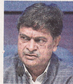
Power Minister RK Singh

In the second part of the policy, which is under the consideration of the Expenditure Finance Committee (EFC), the government will look at issues related to viability gap funding (VGF) and setting up mandates.